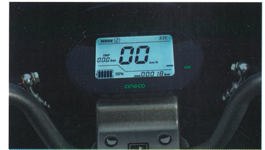
Tableau de bord complet à affichage digital.

Système de Régulateur de vitesse pour un parcours plus facile.